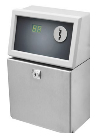
Système à pièce CM 100