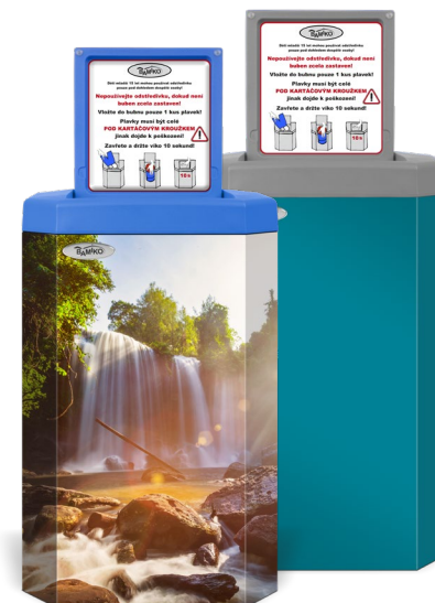
Personnalisation du design