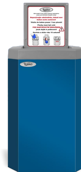
1 Bleu RAL 5017