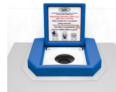
Avec couvercle bleu