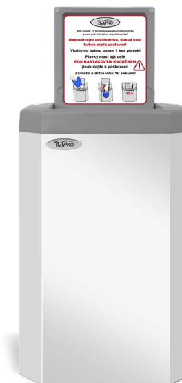
5 Blanc RAL 9003