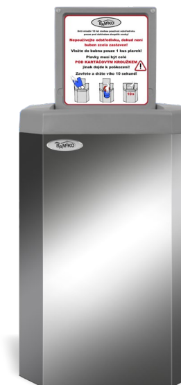
7 Acier inoxydable