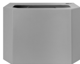
Bac collecteur d'eau - gris