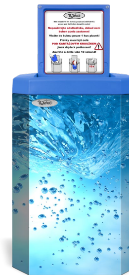
2 Tourbillon d'eau