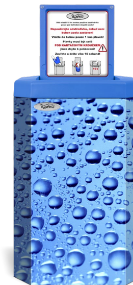
3 Gouttelettes d'eau