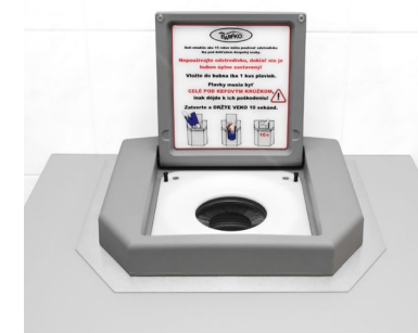
Avec couvercle gris