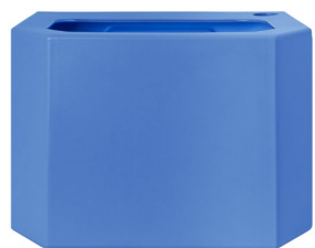
Bac collecteur d'eau - bleu