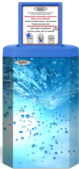
2 Torbellino de agua