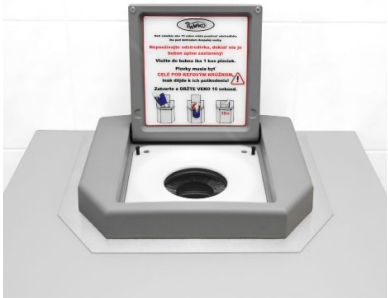
Secador de bañadores - integrado con tapa gris / azul / negra estructura de acero inoxidable