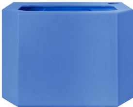
Depósito de agua - azul