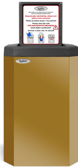
9 Oro metalizado