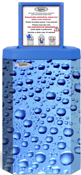
3 Gotas de agua