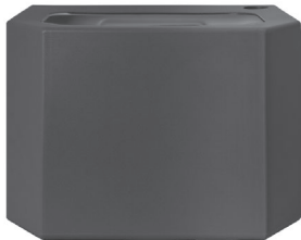
Depósito de agua - negro