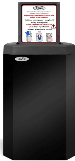
10 Negro mate 9005