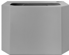
Depósito de agua - gris