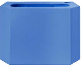
PE-Wasserbehälter - Blau