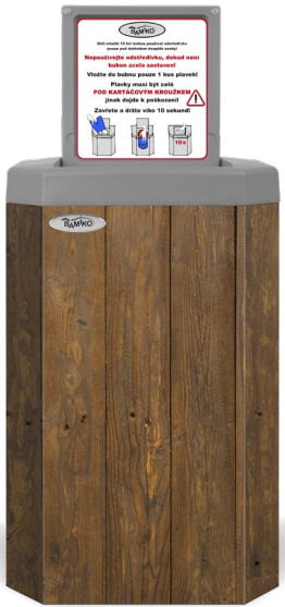
8 Dunkles Holz