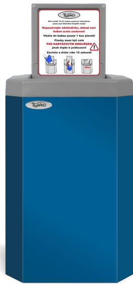
1 Blau RAL 5017