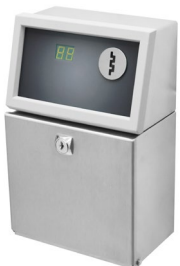
Münzgerät CM 100