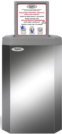
7 Gebürsteter Edelstahl