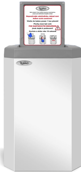
5 Weiß RAL 9003