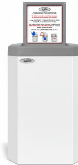
5 Weiß RAL 9003