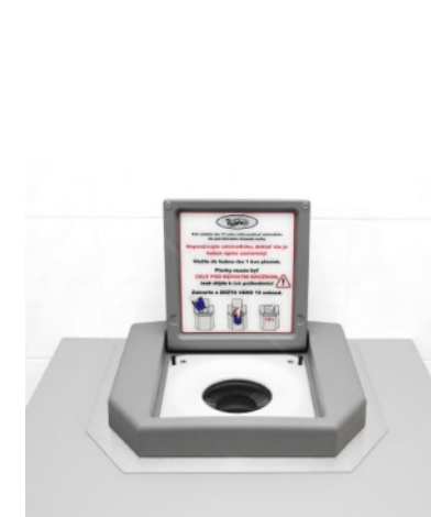
Schleuder für Badebekleidung eingebaut - Blauer/Grauer/Schwarzer Kunststoff