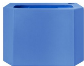
PE-Wasserbehälter - Blau