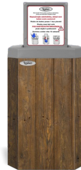
8 Dunkles Holz