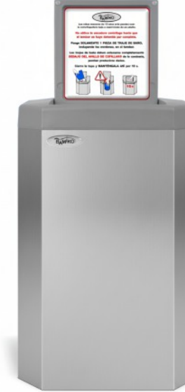
7 Gebürsteter Edelstahl