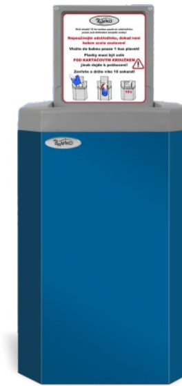
1 Blau RAL 5017