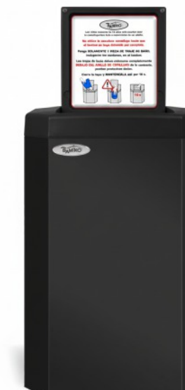
10 Schwarz RAL 9005