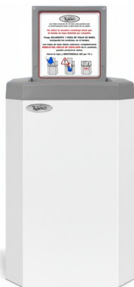
5 Blanco RAL 9003