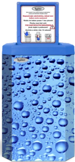
3 Gotas de agua