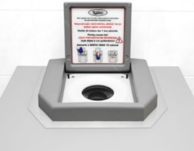
Secador de bañadores - integrado con tapa gris / azul / negra estructura de acero inoxidable