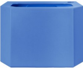
Depósito de agua - azul