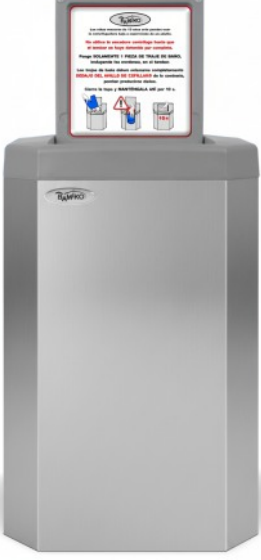
7 Acero inoxidable