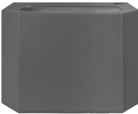
Depósito de agua - negro