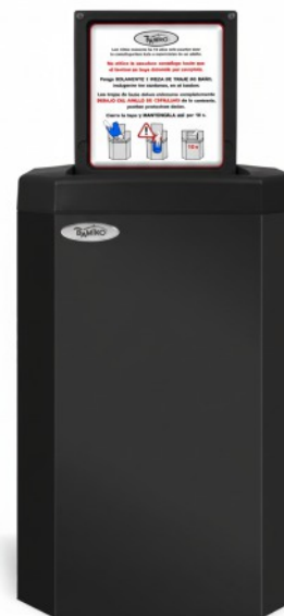
10 Negro RAL 9005