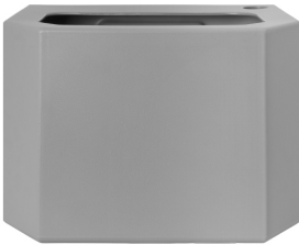
Depósito de agua - gris