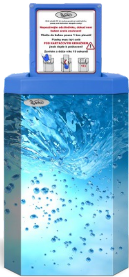
2 Torbellino de agua