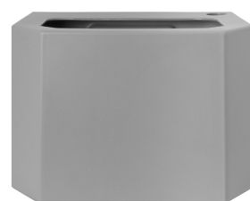
Bac collecteur d'eau - gris