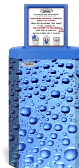
3 Gouttelettes d'eau