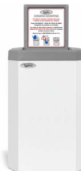
5 Blanc RAL 9003