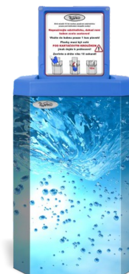
2 Tourbillon d'eau