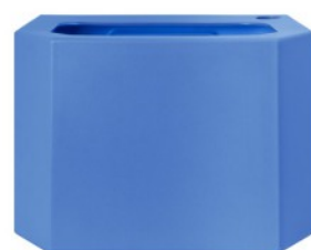
Bac collecteur d'eau - bleu