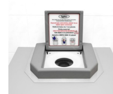
Essoreuse pour maillot de bain – encastrée Avec couvercle bleu / gris / noir