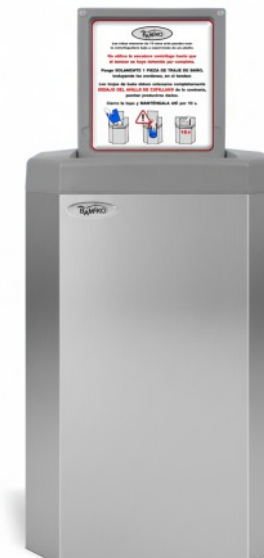
7 Acier inoxydable