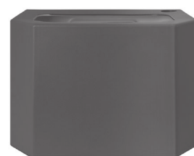
Bac collecteur d'eau - gris