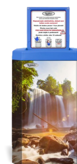
Personnalisation du design