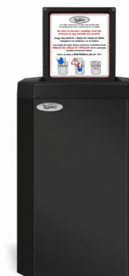
10 Noir RAL 9005