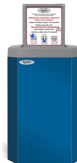
1 Bleu RAL 5017