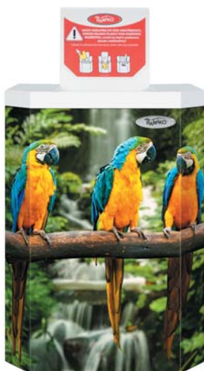
2 Natural kollekcio