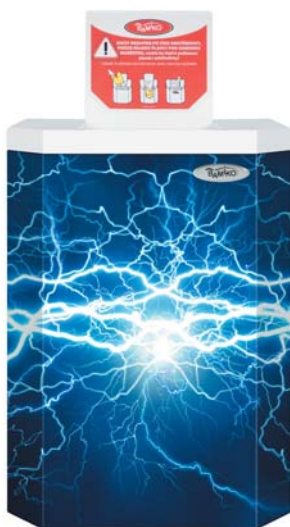
5 Galaxy kollekcio