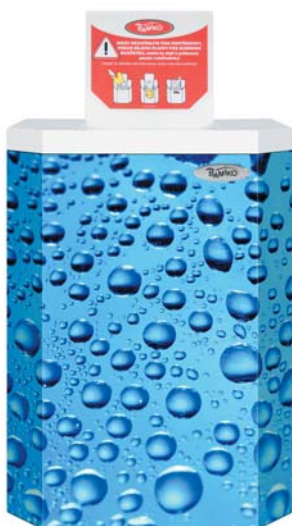
1 Ocean kollekcio