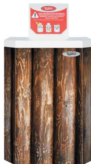
3 Wellness kollekcio