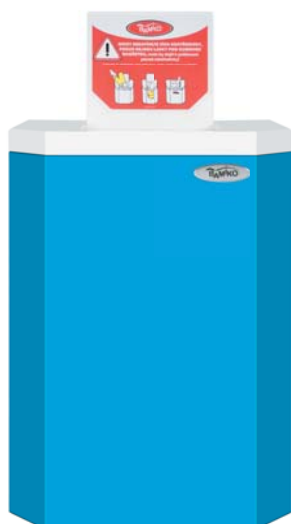
Centrifuga a furdoruhak számára