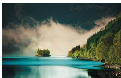
Az Ön javaslata